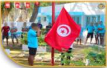
صيف شباب الأهلان صيف الشباب العاجزين 60 مستفيد