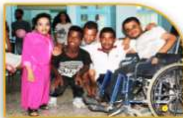
البرامج التدريبية الخاصة بـ 10000 مستفيد