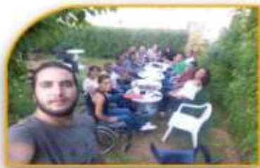
صيف "كاف الشاي" 46 مستفيد